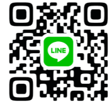
社協公式 LINE は こちら