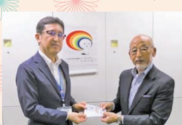
公益社団法人京橋法人会第7・8支部 様