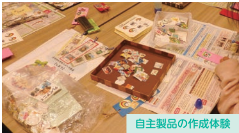
自主製品の作成体験