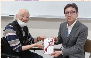
中央区障害者団体連絡協議会 様