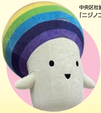
中央区社協キャラクター 「ニジノコ」