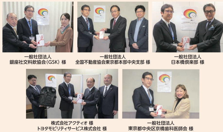
一般社団法人 銀座社交料飲協会(GSK)様

皆さまからいただきました貴重なご寄付は、本会の社会福祉事業等に活用させていただきます。