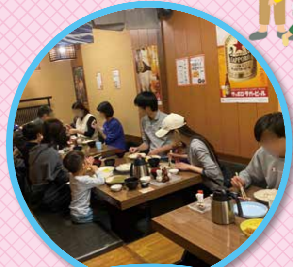
27 ひこまる食堂 (どなたでも)