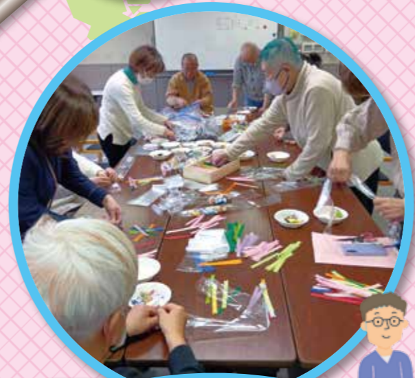
23 ちゅうおうボラネット交流サロン (どなたでも)

中央区の図書館で読み聞かせ活動に携わるボランティア有志とともに運営しています。忙しい日常の中で、絵本の世界に耳を傾けるひときは、大人にとっても心を整える癒しの時間です。物語とともに、「1人分」や「1個」ではなかなか買えない中央区の銘菓を、ぜひお気軽にお味見してみませんか?