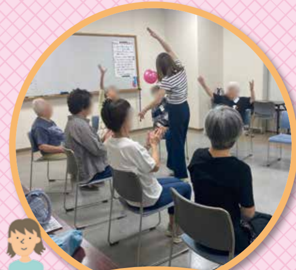
3 銀座ぷらっとサロン (高齢者向け)