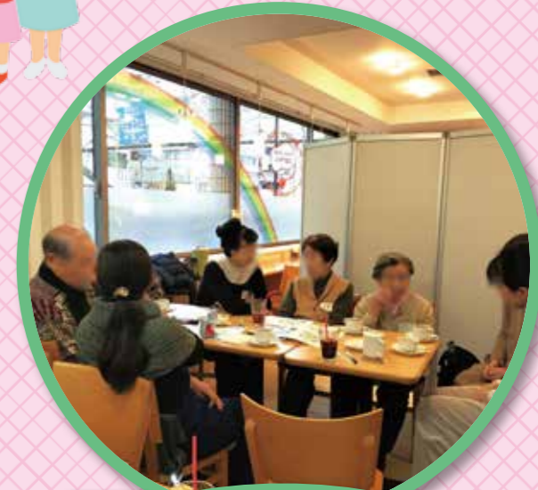
8 明石町カフェ (認知症カフェ)