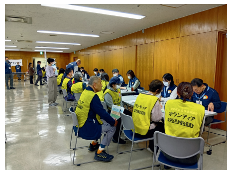
災害ボランティアセンター 運営訓練の様子