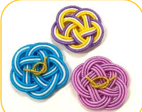
↑初体験の職員作品