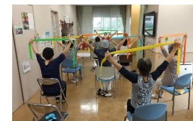
<からだスマイル倶楽部>