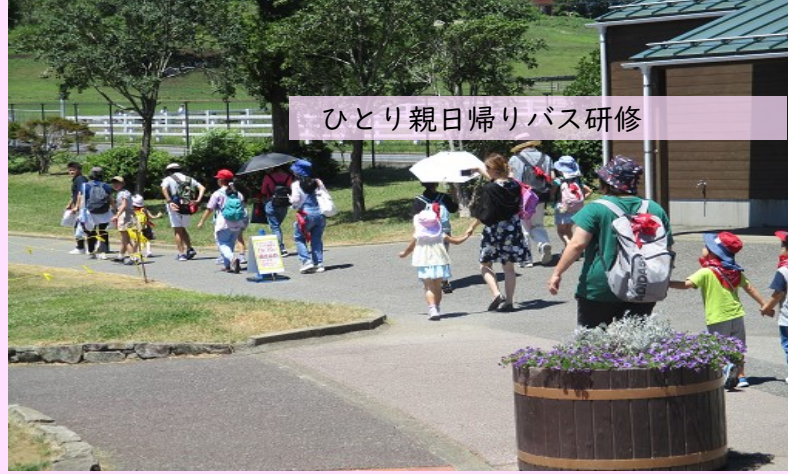
ひとり親日帰りバス研修

歳末たすけあい募金は、共同募金の一環として、区民の皆さまをはじめ、町会・自治会、各種団体、企業など地域のご協力のもとに実施しています。皆さまからお寄せいただいた募金は中央区の地域福祉活動に使われます。