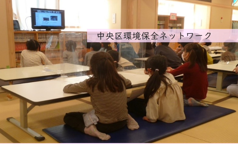
中央区環境保全ネットワーク