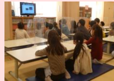
中央区環境保全ネットワーク

皆さまからの募金は、寝たきり高齢者の介護者等へ見舞金として贈呈されるほか、福祉団体やボランティア団体等への助成金としても役立てられています。