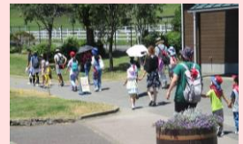
ひとり親日帰りバス研修

※歳末たすけあい募金には税制上の優遇措置があります。ご希望の方は社会福祉協議会までご連絡ください。